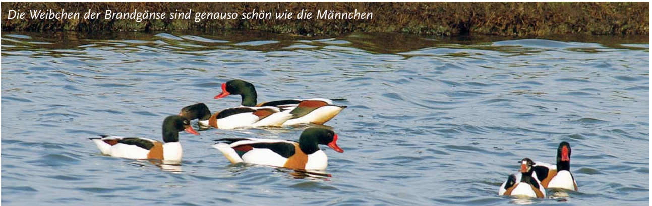
Die Weibchen der Brandgänse sind genauso schön wie die Männchen