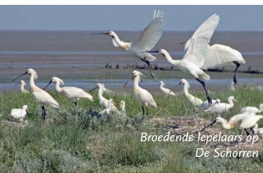
Broedende lepelaars op De Schorren

De Schorren ligt op het wantij van Texel: de plaats waar twee vloedstromen elkaar ontmoeten. Het zijn de vloedstromen van het Marsdiep, de geul tussen Texel en Den Helder, en het Eierlandse Gat, tussen Texel en Vlieland. Je komt er langs tijdens een fiets- of wandeltocht aan de buitenkant van de waddendijk, tussen