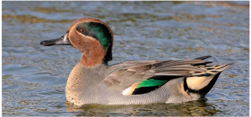
Deze wintertaling slooft zich uit met een schitterend verenkleed

Een volwassen bruine kiekendief-man heeft blauwgrijze vleugelvlekken, zwarte vleugeltoppen en een zilvergrijze staart