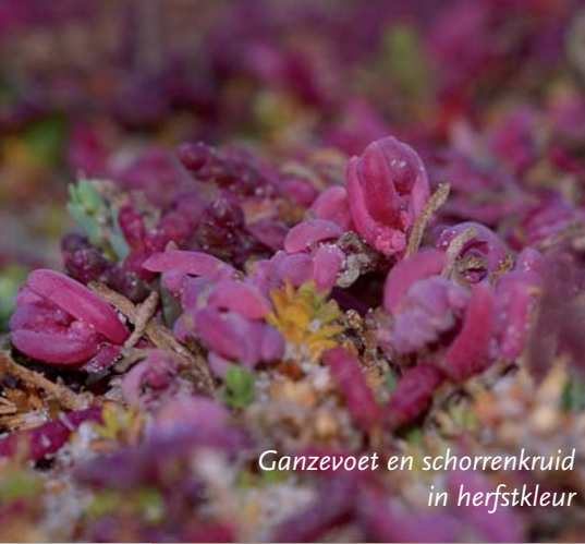
Ganzevoet en schorrenkruid in herfstkleur