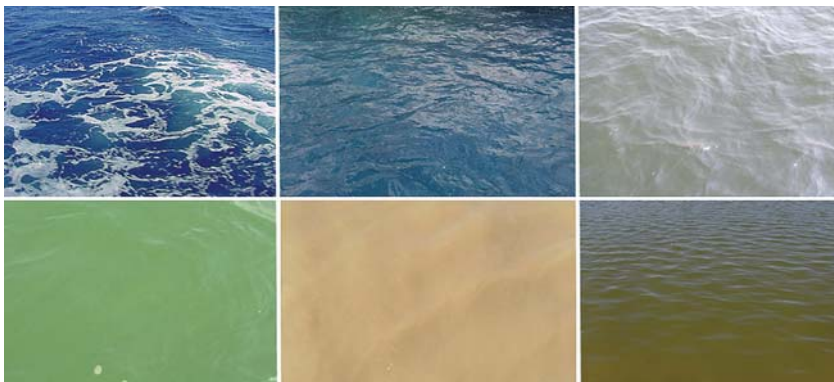
Zes verschillende zee kleuren. Boven: Atlantische Oceaan; Noordzee; Kustgebied Noordzee. Onder: Kustgebied Noordzee bij algenbloei; Waddenzee; Bij een sluis, binnenwater met veel dood organisch materiaal

groen, omdat er veel algen in zitten”, begint Wernand. „Aan het eind van de algenbloei krijg je een bruine, troebele zee en schuim op het strand. Dat zijn de resten van dode algen. Middenin de zomer is de Waddenzee bij Texel meestal helder geelbruin door opgeloste humus. In de winter is hij vaak grijsbruin door slib. Dan stormt het vaker en werfelt het slib omhoog. Vanaf de Teso-boot kun je het verschil tussen eb- en vloedwater goed zien. Het vloedwater van de Noordzee is helder en blauwig. Het ebwater is bruin door het slib van de Waddenzee.”