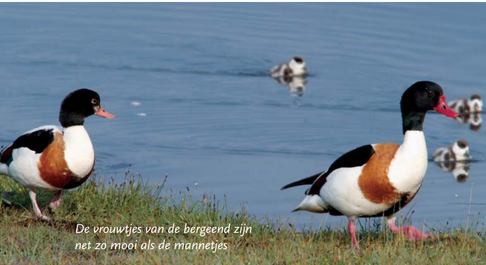
De vrouwtjes van de bergeend zijn net zo mooi als de mannetjes

Men zegt weleens dat onze vogels saai gekleurd zijn, vergeleken met die uit tropische gebieden. Dat is maar ten dele waar. Blader maar eens een vogelboekje door en kijk naar de putter, de wiewaal, de goudvink, het ijsvogeltje en de roodborsttapuit.