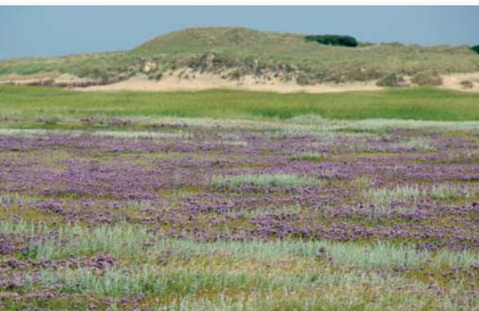
Queller und in der Mitte Gänsefuß

Es beginnt im Mai mit den hell rosa Blütenköpfen der Grasnelke. Die Büschel wachsen vor allem auf den höheren Bereichen der Ebene. Mit Gräsern hat diese Pflanze